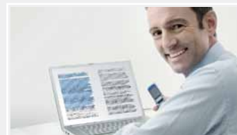
Odbiór gotowych plików na mail lub katalog osobisty oraz edycja