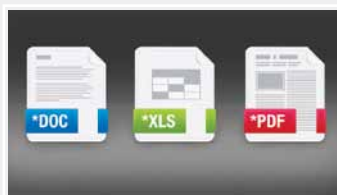
Wybór docelowego formatu dokumentu

→ Konwersja do MS Word, MS Excel lub PDF