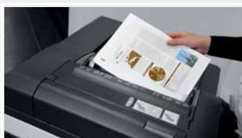
Wprowadzenie dokumentu do podajnika

→ Przygotowanie papierowych stron do skanowania